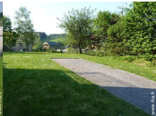
jeux de boules de pétanques