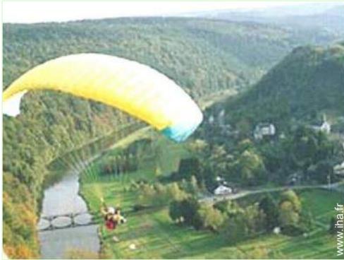
loisirs aériens à proximité