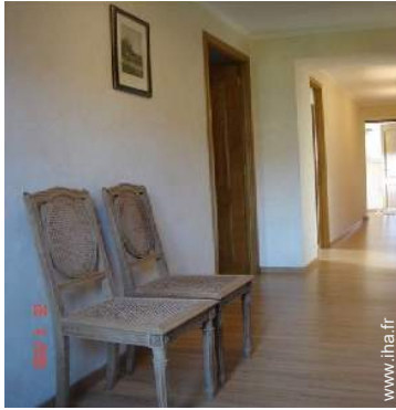
vue depuis la mezzanine