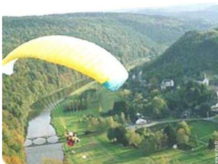
loisirs aériens à proximité