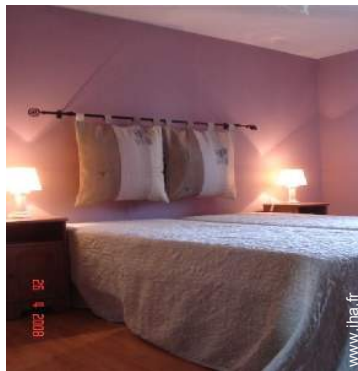
chambre du propriétaire