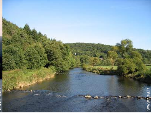
vue sur rivière