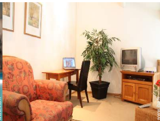
wifi (accès internet sans fil)