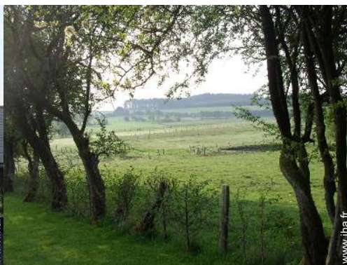
vue sur prairie