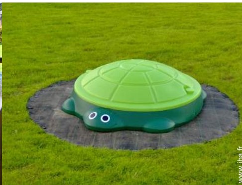
bac à sable