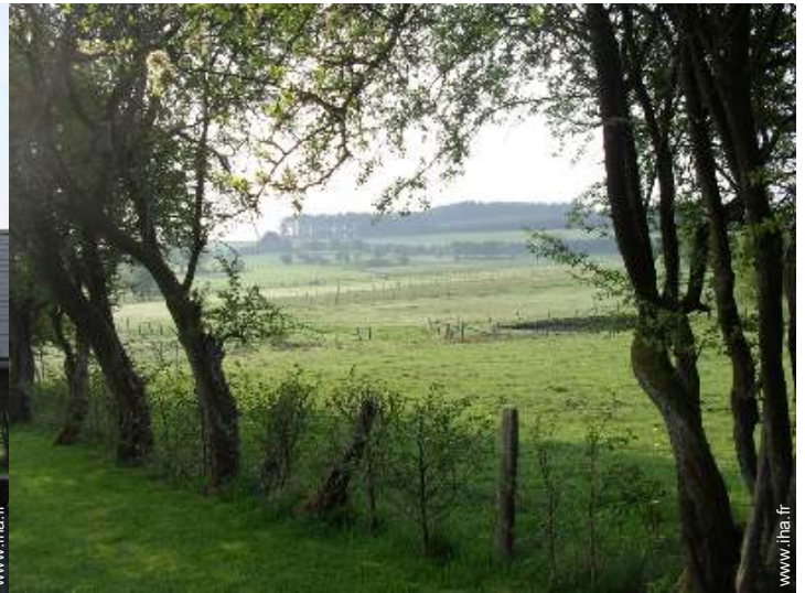
vue sur prairie