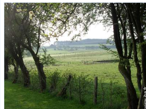
vue sur prairie