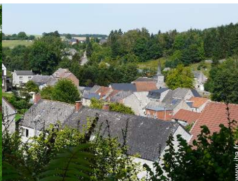
vue sur village