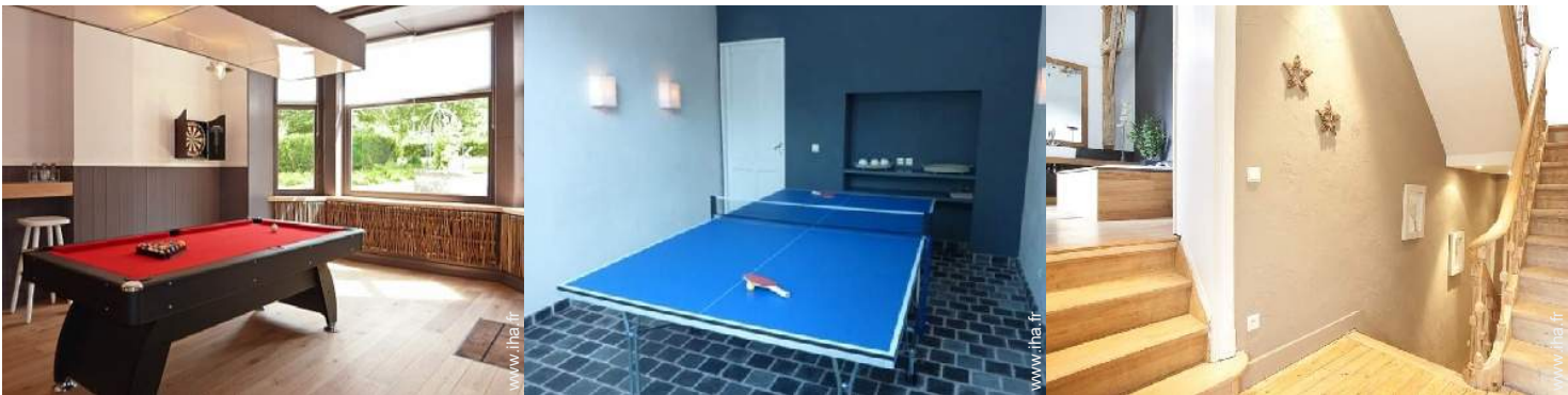
table de billard