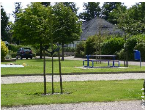
terrain de pétanque