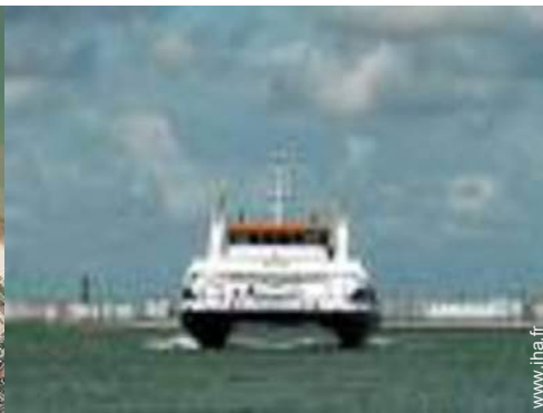
spot de windsurf