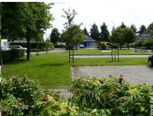
terrain de pétanque