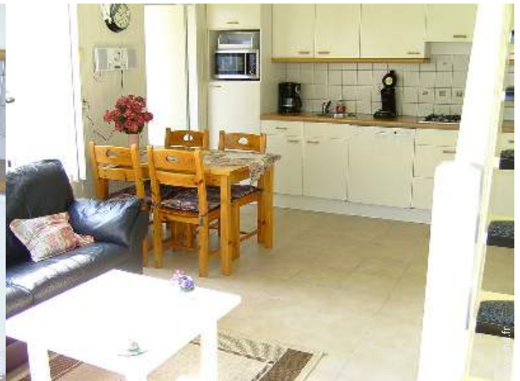
vue depuis la salle à manger