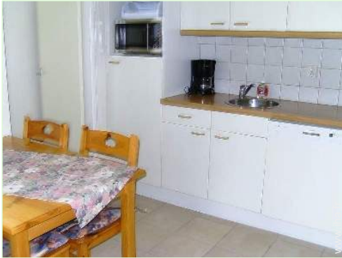
vue depuis la salle à manger