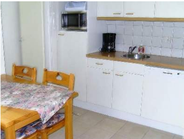
vue depuis la salle à manger