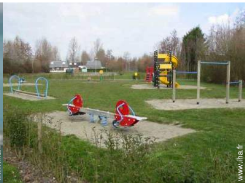
loisirs à proximité