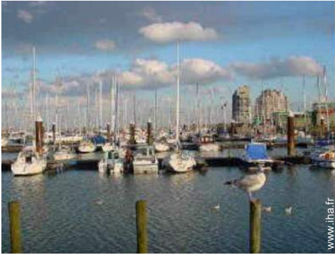
port de plaisance