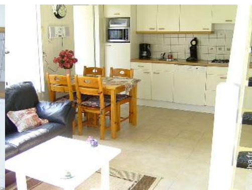
vue depuis la salle à manger